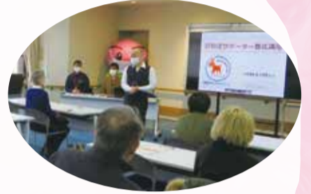
認知症サポーター養成講座の様子

中央区キャラバン・メイト連絡会は、偶数月第2水曜日に開催しています。認知症サポーター養成講座・フォローアップ講座の企画、ももカフェの運営を行っています。中央区では、認知症に対する理解を広げていくため、キャラバン・メイトだけではなく認知症サポーターのみなさんにも参加を呼びかけ一緒に活動をしています。