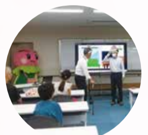
認知症キッズサポーター養成講座の様子