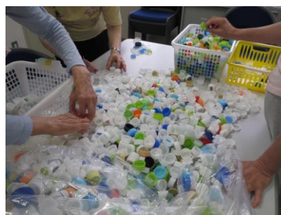
色付キャップと白色キャップに仕分けします。