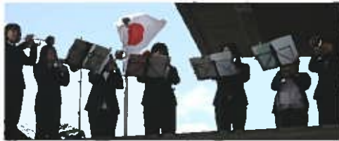
● 相愛大学音楽学部のファンファレで開会

● 昨年3月11日の東日本大震災で東北地方は大きな被害を受け現在も復興に前向きに取り組まれています。 ● CFKでは昨年1月に、「大阪から元気を届けたい」との思いで、チャリティフェスティバルを開催しました。 ● 2回目となる今回は「被災された経験をもっと知り、他人事ではなく自分のこととして考えてみよう！」という思いから～CFKチャリティフェスティバル忘れへんで3.11part2～を開催しました。