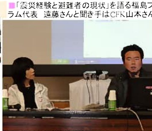
■ 「CFKチャリティフェスティバル」の仲間たち・・・